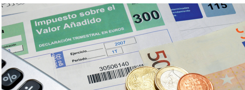
Impres per a declarar l'impost sobre el valor afegit o IVA

L'impost indirecte més important és l' impost sobre el valor afegit (IVA) , que grava tots els productes que són objecte de transacció econòmica i que acaba repercutint sobre el consumidor final. Altres tipus d'impostos indirectes són els que s'apliquen als combustibles o a la matriculació dels vehicles, per exemple.